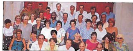
■ La classe 1945, il y a 23 ans, en 1990.

Les animateurs et boute-en-train ne manqueront pas de chauffer "les vieux classards" avec des chansons anciennes et de vieilles histoires, se remémorant avec humour et nostalgie les nombreux événements vécus du-