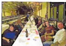
■ Les vétérétistes ont aussi un bon coup de fourchette.